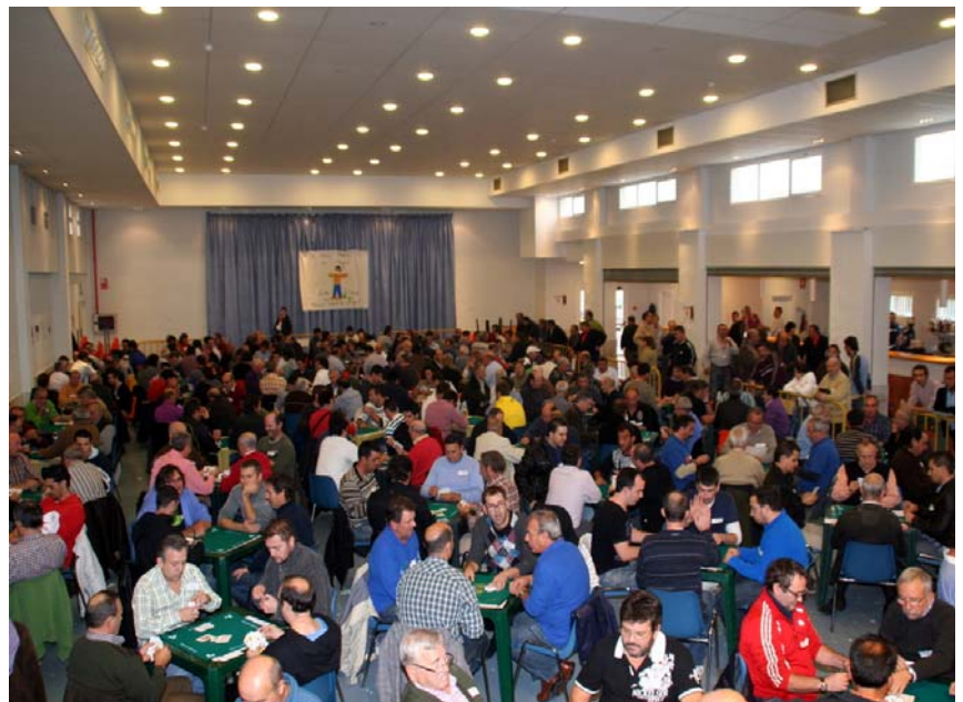
Imagen de algunos jugadores durante las primeras fases del torneo

La XV edición del Campeonato de Guiñote de Novallas ha vuelto a ser un éxito organizativo. En esta edición, que tuvo lugar el 26 de noviembre, se ha logrado un record de participación con 144 parejas , lo que requirió un esfuerzo de coordinación superior al de años precedentes para lograr que la competición se desarrollase con normalidad . Los jugadores disputaron durante todo el día sucesivas rondas para dilucidar cual de las parejas se haría con el premio de 4000 euros. Durante la jornada los jugadores disfrutaron de un almuerzo y una comida.