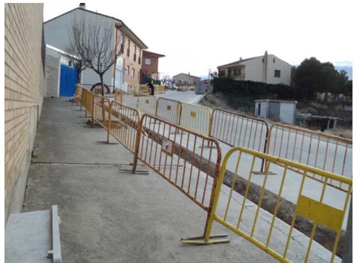
Obras de canalización por la calle Príncipe Felipe

El coste total de las obras es de 400.000 euros, de los cuales el Ayuntamiento ha aportado 100.000 euros.