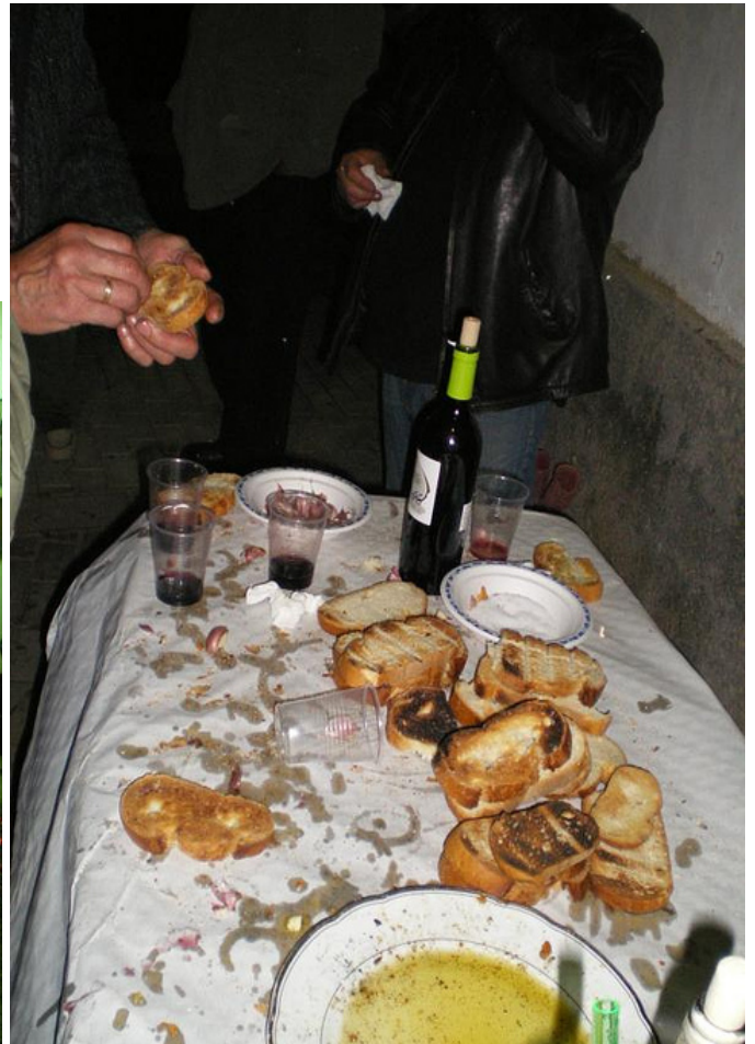
La tradicional hoguera y las tostadas con ajo y aceite fueron los protagonistas