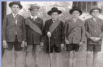
1959. Ayuntamiento infantil. Se organizaban actividades para los más jóvenes.